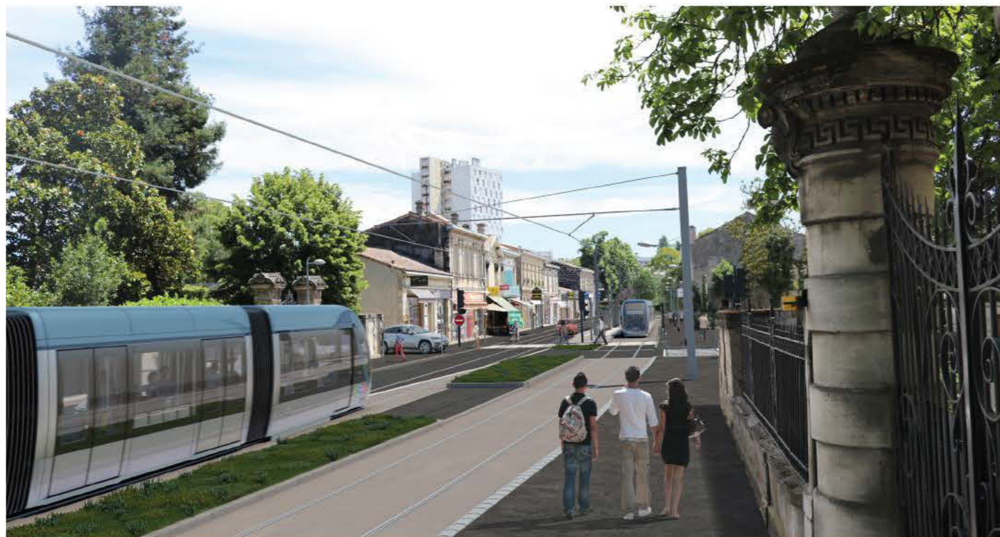
LE BOUSCAT - CALYPSO - LIGNE D - LE TRAMWAY DE BORDEAUX MÉTROPOLE ©