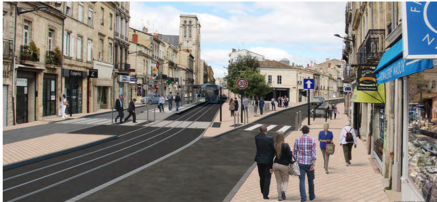
BORDEAUX - RUE FONDAUDEGE - PLACE MARIE BRIZARD - LIGNE D - LE TRAMWAY DE BORDEAUX MÉTROPOLE ©

Réalisation : LAPAO - Impression : L'ATELIER de Bordeaux Métropole