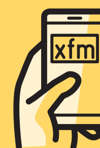
Navigateur internet lien raccourci