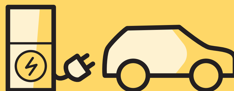
Débranchez côté véhicule

Libérez la place de stationnement une fois votre charge terminée.